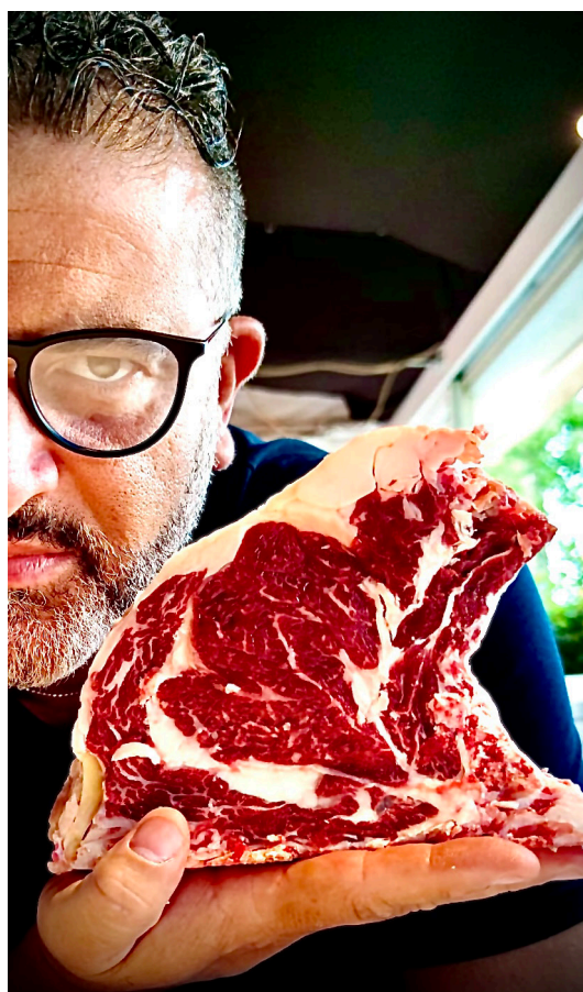
Guarda che Manzo! Ma dai un occhio anche alla bistecca..